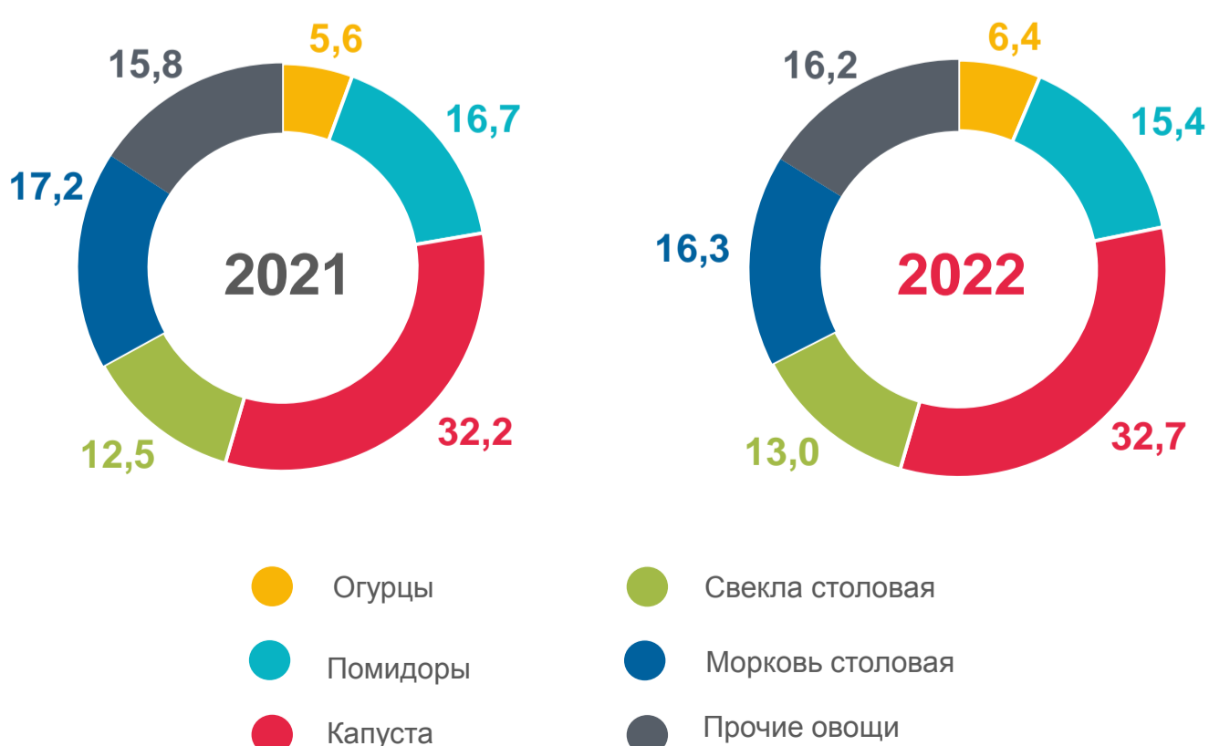
ПРОИЗВОДСТВО ОВОЩЕЙ ОТКРЫТОГО ГРУНТА (ВКЛЮЧАЯ ЗАКРЫТЫЙ ГРУНТ ПО НАСЕЛЕНИЮ) ПО ВИДАМ, В % ОТ ОБЩЕГО ОБЪЕМА ПРОИЗВОДСТВА