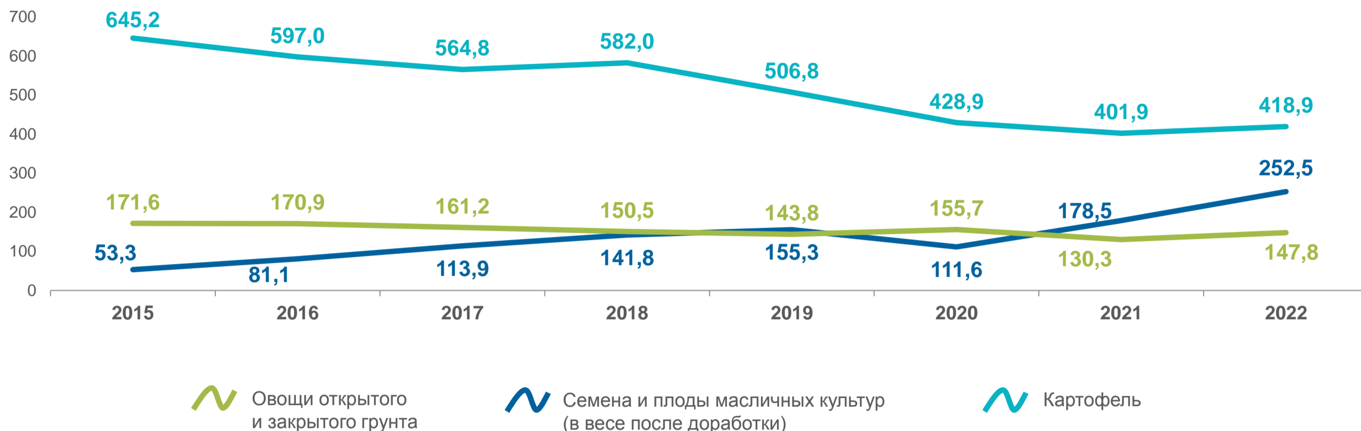
ПРОИЗВОДСТВО ПРОДУКТОВ РАСТЕНИЕВОДСТВА ПО КАТЕГОРИЯМ ХОЗЯЙСТВ, В % ОТ ОБЩЕГО ОБЪЕМА ПРОИЗВОДСТВА В ХОЗЯЙСТВАХ ВСЕХ КАТЕГОРИЙ